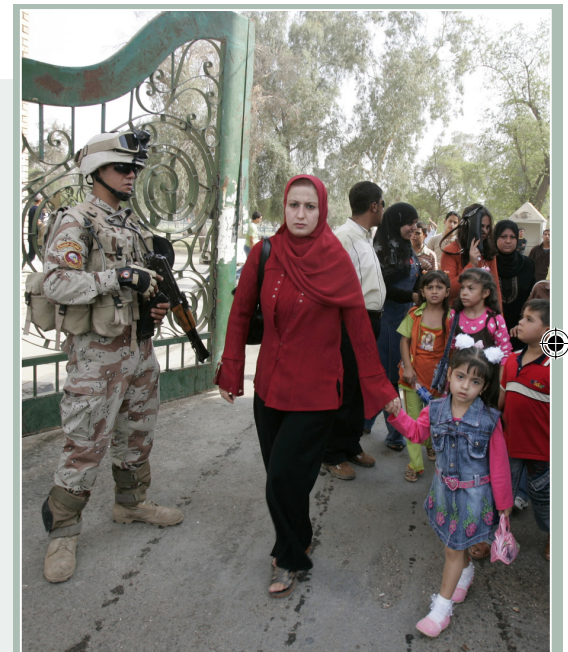
The U.S. may need to change its approach to win hearts and minds in the Muslim world.

Quickly upon taking office, the next president should initiate a strategic planning process leading to a National Security Presidential Directive for improving our relationship with the Muslim world. The president should also take personal steps to use a limited window of opportunity to "reboot" that relationship, such as taking an early presidential trip to Muslim nations, meeting with reporters from Arabic-language media, and clearly condemning anti-Islamic bias. The strategy should then be institutionalized, backed by specific policy initiatives, including: